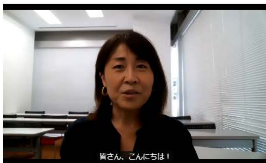
課程負責人的致辭